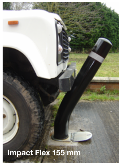
Impact Flex 155 mm

Impact Flex och Manchester Flex kommer märkta med 3M klass 1 reflextejp för optimal synlighet.