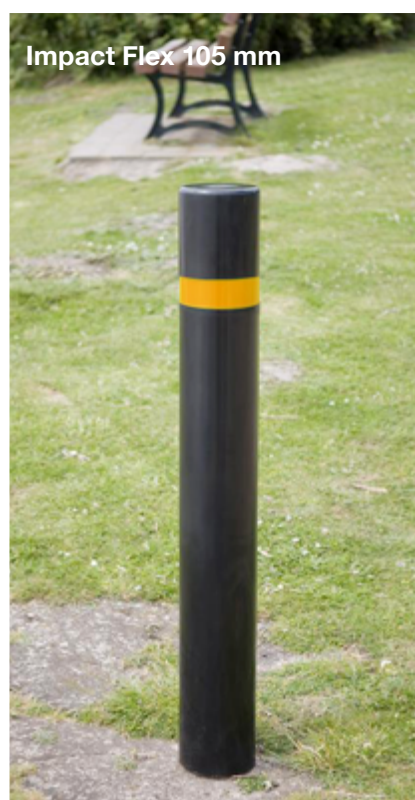
Impact Flex 105 mm